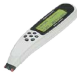
クイックショナリー2 漢字リーダー

ホームページアドレス http://www.nakagawa.biz を入力してください。